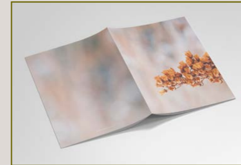
1. OKRA 15 EUR