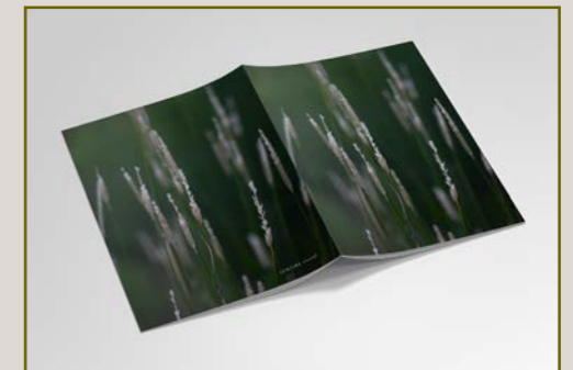
5. VIHREÄÄ 15 EUR