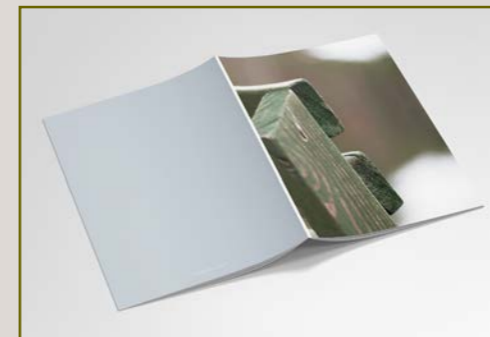
2. TYHJÄ PENKKI 15 EUR