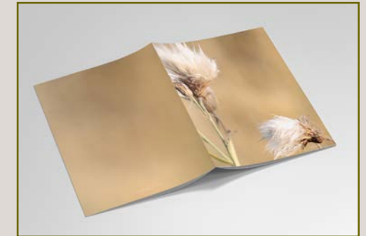
4. VALO 15 EUR